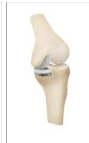
Oberflächenersatz nur auf der Innenseite des Knies