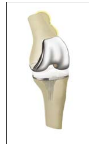
Oberflächenersatz am ganzen Kniegelenk