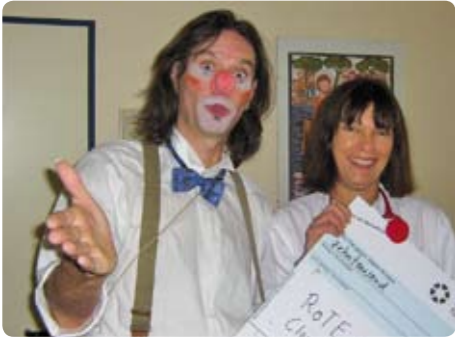
„Clownvisite Rote Nasen“