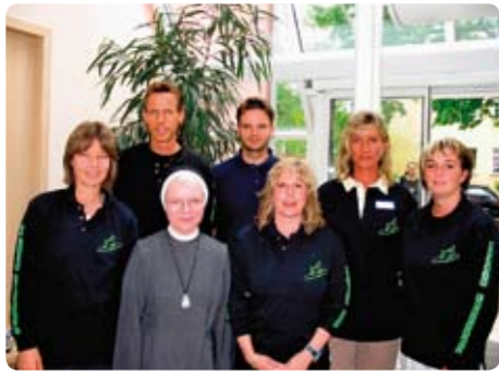
Aus dem Team der Kinder- und Jugendpsychiatrie