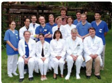
Aus dem Ärzteteam der Kinderklinik und Kinderchirurgie