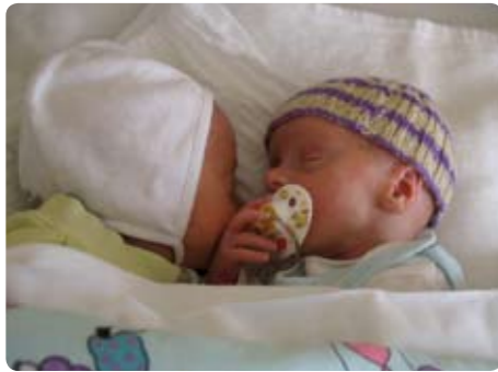
Zwillinge in der Kinderklinik