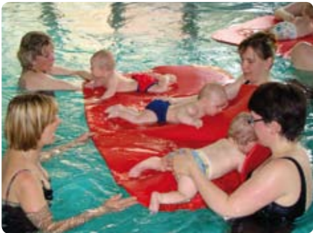
„Babyschwimmen“ im Hallenbad der Kinderklinik