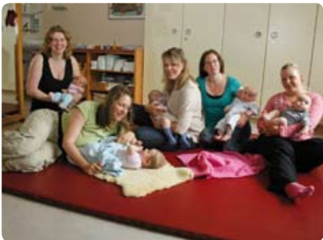
Stillgruppe in unserer Elternschule