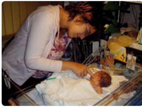
Eine Woche auf unserer Welt