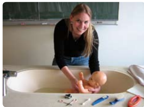
Anleitungen zur Säuglingspflege im Rahmen der Elternschule