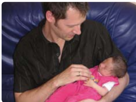
Kurse für Väter in unserer Elternschule