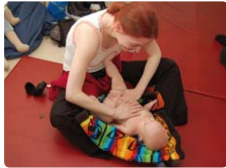
Kurse für Babymassage in unserer Elternschule