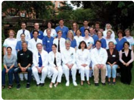
Aus dem Team der Kinderklinik und Kinderchirurgie