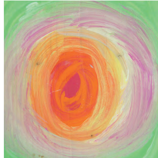
Dieses Bild entstand mit Kindern und Erzieherinnen in der Kinderklinik im Rahmen des Projektes Wir malen auf Holz im Mai 2007.