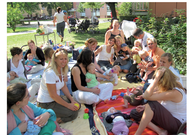
Stillbrunch im Innenhof des Krankenhauses

11 bis 13 Uhr, Kinderklinik, 3. Etage (Unkostenbeitrag 1,- Euro)