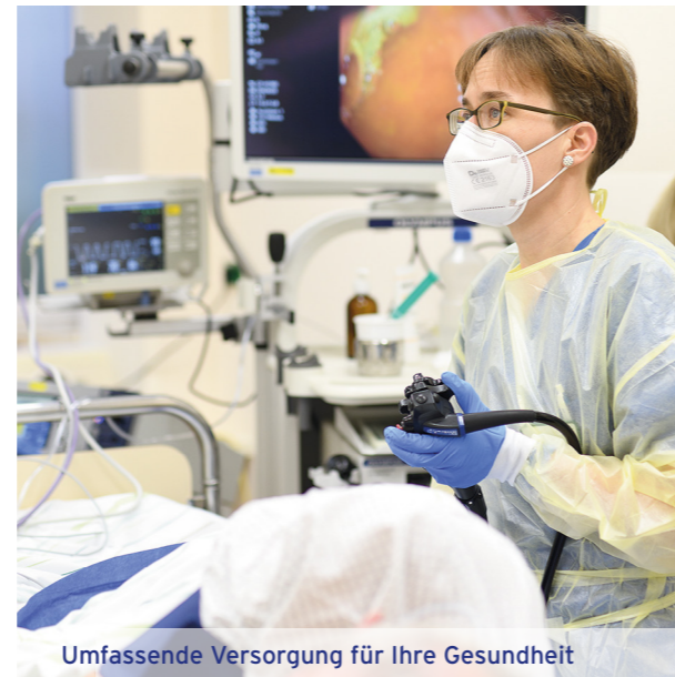
Umfassende Versorgung für Ihre Gesundheit