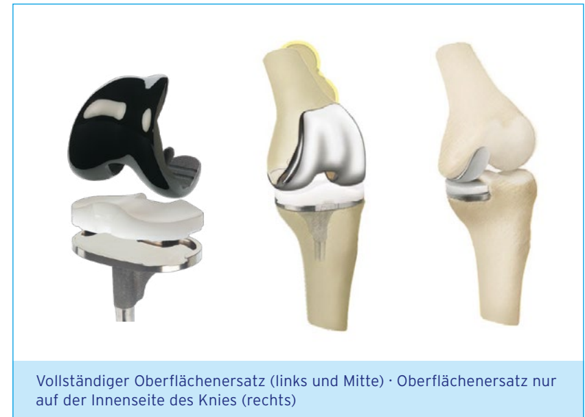
Vollständiger Oberflächenersatz (links und Mitte) · Oberflächenersatz nur auf der Innenseite des Knies (rechts)

Der Kniegelenkersatz ist in den meisten Fällen ein unproblematischer Eingriff; Sie sollten jedoch wissen, welche Komplikationen auftreten können. Fragen Sie hierzu bei der Schulung sowie im anschließenden persönlichen Aufklärungsgespräch Ihre behandelnde Ärztin oder Ihren Arzt.