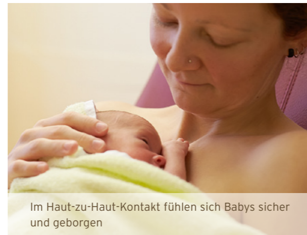
Im Haut-zu-Haut-Kontakt fühlen sich Babys sicher und geborgen

Mehrere Degum II Ultraschallspezialisten komplettieren unser Angebot.