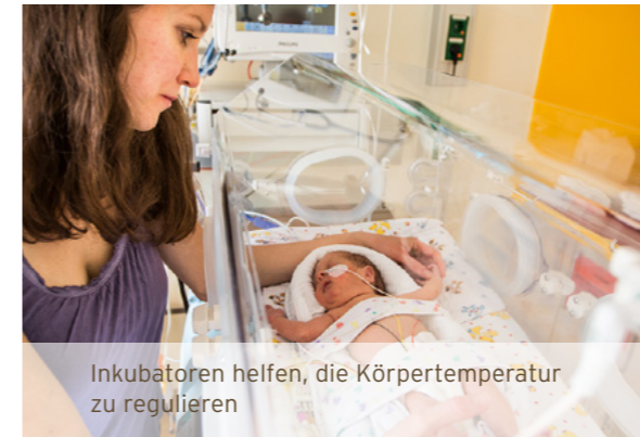
Inkubatoren helfen, die Körpertemperatur zu regulieren