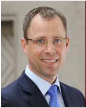
Mario Czaja Senator für Gesundheit und Soziales

Die Lebens-, Entwicklungs- und Bildungsbedingungen für junge Menschen haben sich in den letzten 20 Jahren stark gewandelt. Während die Mehrzahl der Kinder und Jugendlichen mit den veränderten Bedingungen des Aufwachsens zurechtkommt, nimmt das Risiko zu, psychische Auffälligkeiten zu zeigen, an einer psychischen Störung zu erkranken und unterstützende Hilfen und Therapie in Anspruch nehmen zu müssen. Untersuchungen weisen darauf hin, dass ca. 20 bis 25 Prozent der Kinder und Jugendlichen psychische Auffälligkeiten und Entwicklungsstörungen zeigen. Bei ca. 5 bis 8 Prozent besteht Behandlungsbedürftigkeit. Während organische Krankheiten bei Kindern abnehmen, nehmen seelische Probleme zu und drohen zu chronifizieren.