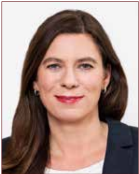
Sandra Scheeres Senatorin für Bildung, Jugend und Wissenschaft

Die Lebens-, Entwicklungs- und Bildungsbedingungen für junge Menschen haben sich in den letzten 20 Jahren stark gewandelt. Während die Mehrzahl der Kinder und Jugendlichen mit den veränderten Bedingungen des Aufwachsens zurechtkommt, nimmt das Risiko zu, psychische Auffälligkeiten zu zeigen, an einer psychischen Störung zu erkranken und unterstützende Hilfen und Therapie in Anspruch nehmen zu müssen. Untersuchungen weisen darauf hin, dass ca. 20 bis 25 Prozent der Kinder und Jugendlichen psychische Auffälligkeiten und Entwicklungsstörungen zeigen. Bei ca. 5 bis 8 Prozent besteht Behandlungsbedürftigkeit. Während organische Krankheiten bei Kindern abnehmen, nehmen seelische Probleme zu und drohen zu chronifizieren.